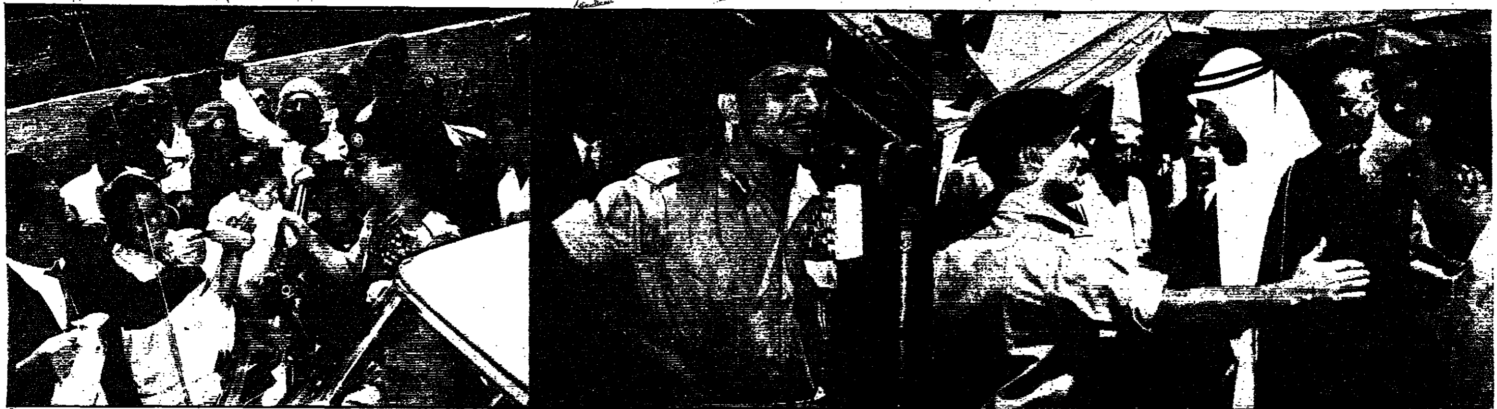
جلالة الملك يبقى كلية في مخيم القبة «تصوير أ.أ.» | جلالة الملك يبقى كلية في مخيم القبة «تصوير أ.أ.» | جلالة الملك يبقى كلية في مخيم القبة «تصوير أ.أ.»